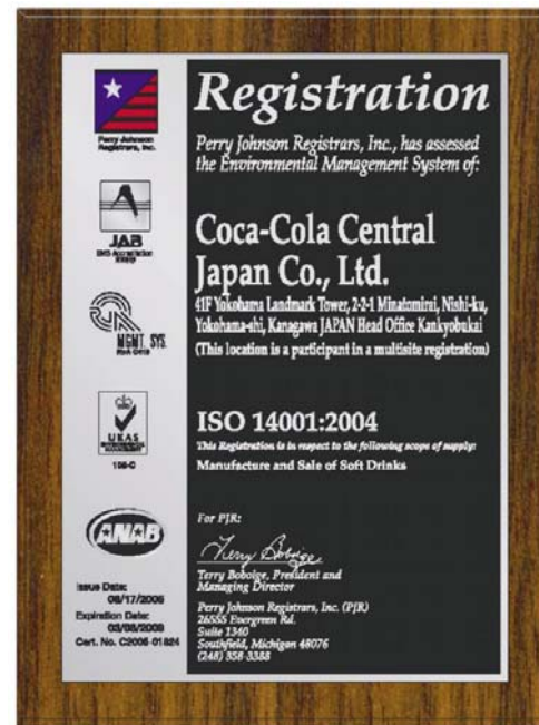
Modelo da placa (opcional) semelhante àquele que sua Organização receberá